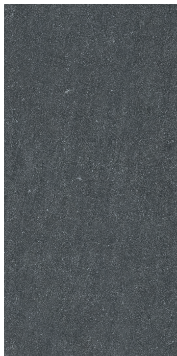
30 x 60 cm (12" x 24") Fini mat HV.LS.BLK.1224.MT

Tous les items présentés dans ce document font partie du programme d'inventaire Olympia. Pour les commandes spéciales, veuillez contacter votre représentant de Tuiles Olympia.