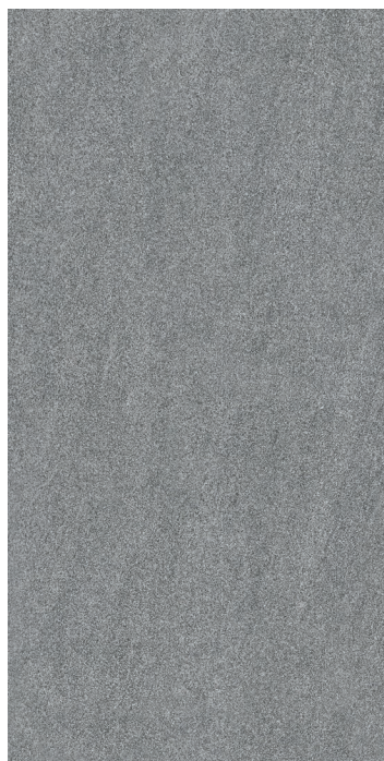
30 x 60 cm (12" x 24") Fini mat HV.LS.DGR.1224.MT